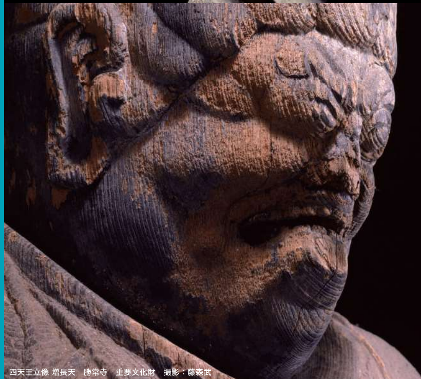
四天王立像 増長天 勝常寺 重要文化財